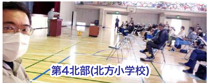
第4北部(北方小学校)