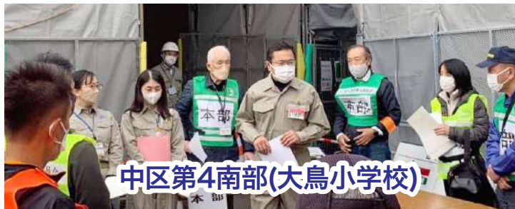
中区第4南部(大鳥小学校)

11/5、地域代表者による中区第4南部(大鳥小学校)・第4北部(北方小学校)地域防災拠点訓練が実施されました。コロナ感染者対策をはじめ、運営方法について濃い内容です。いかに被害を最小限に食い止めるか。引き続き、命を守る取り組みに全力です。