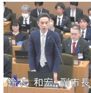
鈴木 和宏 副市長